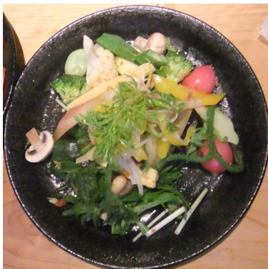
薬膳やさいサラダ

からだをきれいにする食、こころをほぐす食、いきる力となる食、食を通じてつながった畑や魚釣り仲間、などなどのお話も伺えます。プラス、参加者同士の情報交換も楽しみです。