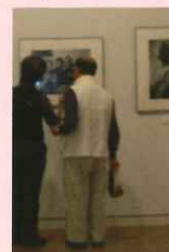
▲写真展では 複製画がいつでも 鑑賞するガイドも行っています。

プロ受賞写真家は、初回の広河隆一さんから 2015 年度の鈴木理策さんまで、現在の写真界をけん引する錚々たる顔ぶれとなっています。もちろん、石川真生さんもそのひとり。身近には、毎年順繰りで市立小学校にて「子ども写真教室」を行ったり、「私のこの 1 枚写真展」開催など写真普及イベント、市民参加イベントにも取り組んでいます。自治体主催のわたしたちの税金を使って取り組まれる文化事業として、写真愛好家だけでなく、市民ひとりひとりがもっと誇ってほしい、もっと関心を持ちたいところです。