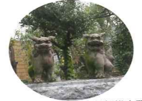
▲南区相模大野でみつけたシーサー