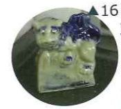
▲16号線沿いのマンションでも玄関先で悪霊払い