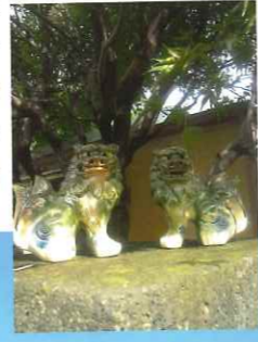
▲南区緑道近くのお家でみつけ