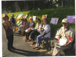
▼クリスマス飾りにまぎれそうな可愛いシーサーでした

そのときは、座間からコメから調味料まで食料持参で、地元でシェアリングしている一軒家を拠点にしているそうで、つい先日までは、カレー隊の弁当作りまでしていたそうです。 そのほかにも、国会前のデモやドキュメント映画の上映など、常に社会問題と向き合っています。かつては、自然食の弁当屋を営むなど経済的に自立しながら社会とかかわってきました。その芽はさかのぼれば、小学校のPTAの民主化や主婦の問題、食の問題等くらしと政治に目を向けてきことによるものかもしれません。 お話をうかがっていると、「子孫に美田を残さず」の精神で、好きなことをできるまで続けていきたいと3氏は言います。いつも3人一緒なので姉妹と間違われるそうですが、座間の元氣いっぱい3人娘の活躍に、当分、目を離せそうにありません。