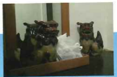
▲友人宅では玄関の外側ではなく内側で魔除けしてました